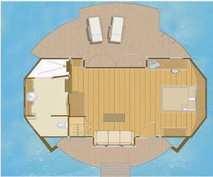
Overwater Bungalow: 594 sq foot / Bungalow Pilotis : 55 m 2