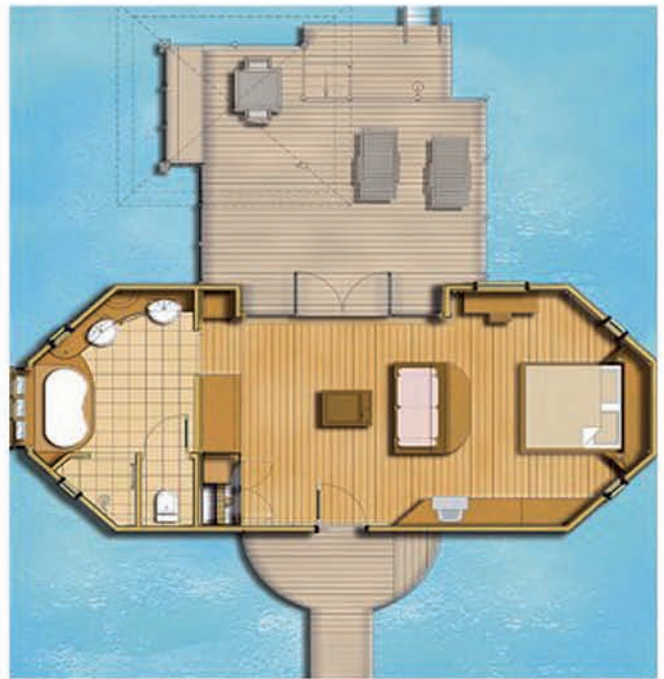
Overwater Suite: 1001 sq foot / Suite Pilotis : 93 m 2